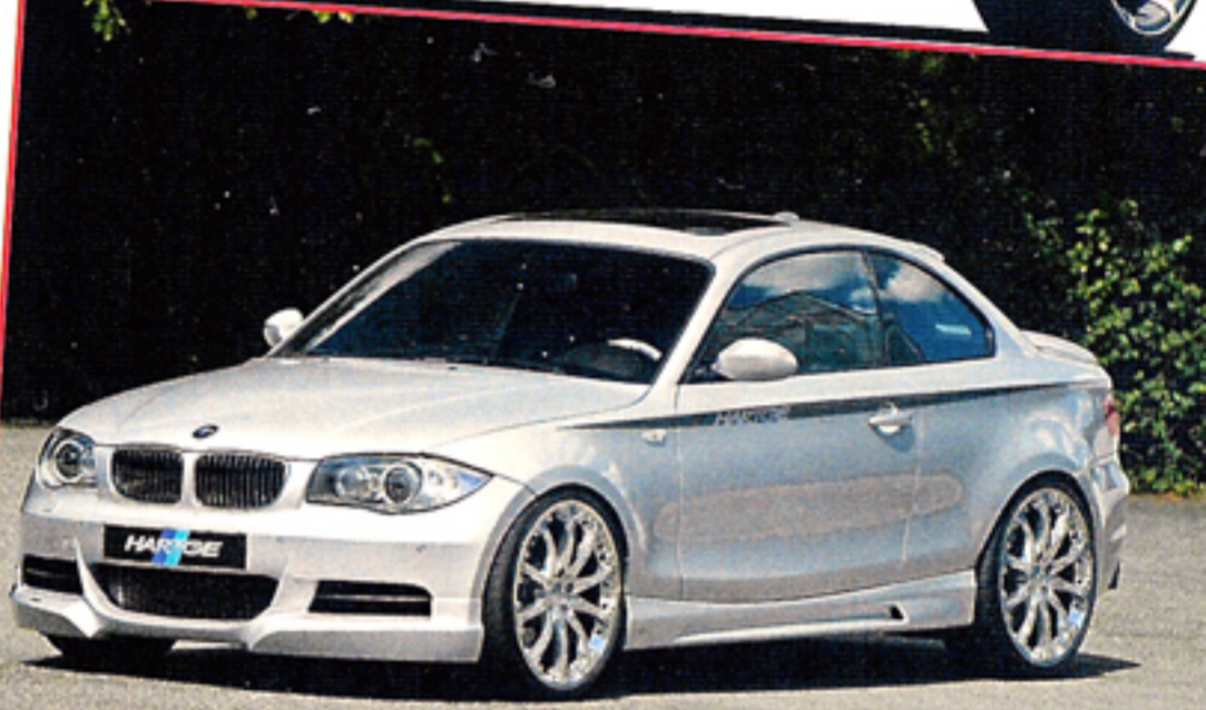
135i von Hartge