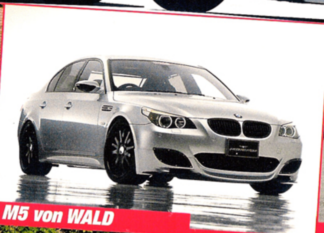
M5 von WALD